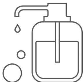
Gel hydroalcoolique à disposition