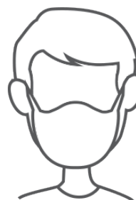
Port du masque conseillé